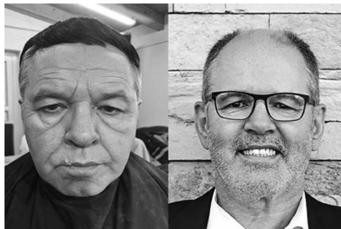
Schminkbeispiel: rechts original, links nach dem Schminken für eine Rolle.

Wenn du Interesse an dieser Aufgabe hast und gern in einer Gruppe mitmachen möchtest, bei der Spaß im Vordergrund steht, aber natürlich auch terminliche Verpflichtungen während unserer Aufführungssaison vorhanden sind, melde dich für weitere Informationen beim Theaterkarren e.V. unter Mail vorstand@theaterkarren.com oder Tel. 01 72 / 7 32 98 97.