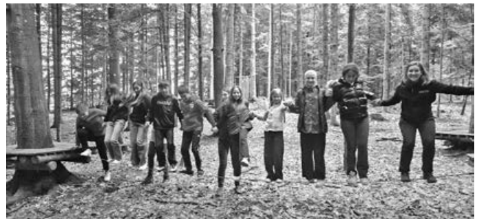
Erlebnisreiche Tage im Schullandheim in der Waldakademie Mönchhof

Ein ganz herzlicher Dank geht an den Förderverein des SZR, dank dessen Zuschuss die Kinder schöne und unbeschwerte Tage erleben konnten.