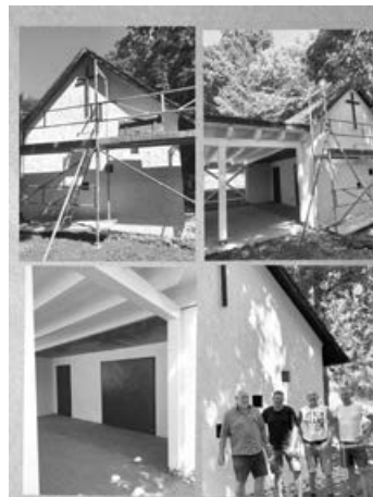
Vorher/Nachher und die fleißigen Arbeiter

Der Innenraum und die Friedhofsstufen werden im Herbst angegangen.