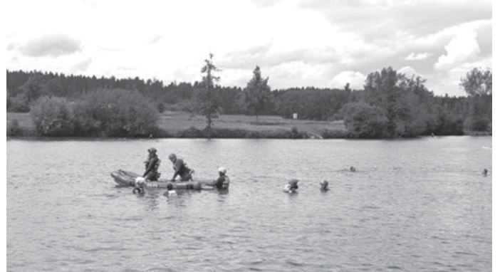
Strömungsretter auf einem

wie mit Sicherheitssignale beschäftigt und ausgiebig geübt. Hierfür wurde im Rahmen der Seewache am Aichstrutsee unter anderem geübt wie man die Rafts schnell und sicher zu Wasser bringen und genauso auch wieder heraus bekommt. Auch das Flippen (auf den Kopf drehen) und Reflippen (wieder zurückdrehen) wurde ausgiebig geübt und trainiert. Umdrehen des Raft, kann bei Stömung durch Hindernisse im Wasser oder Fahrfehler passieren.