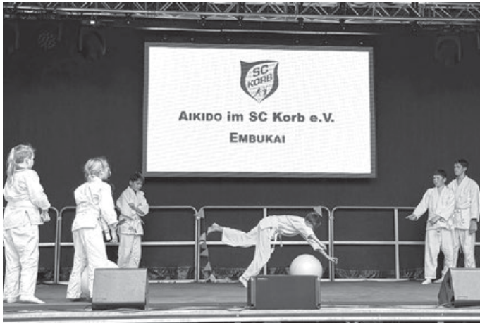
Fallübung über den rollenden Ball

13 Kinder und Jugendliche und 4 Erwachsene , im Alter von 6 bis 66 Jahren, sind auf der Bühne des Seeplatzfestes aufgetreten und haben Aspekte des Trainings und Techniken, die zu Gürtelprüfungen gelernt werden, gezeigt.