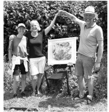
Engagierte im TerraVita bei der Gartenkultour.