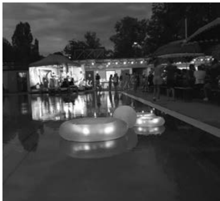
Sommerstimmung im Bädle

Live Musik zum Mittanzen, Einlass ab 18:30 Uhr