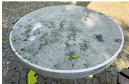
Auch Tische und Bänke wurden durch das Feuer in Mitleidenschaft gezogen.

hätte das Sonnensegel im Masvingo-Park wertvollen Schatten gespendet, insbesondere für Kinder, Familien und Senioren und alle, die den Park als Treffpunkt nutzen. Durch die Beschädigung muss das Segel nun zunächst vollständig demontiert werden. Der dringend benötigte Sonnenschutz steht damit vorerst nicht zur Verfügung.