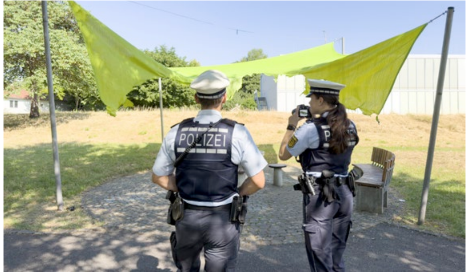
Die Polizei hat die Ermittlungen nach den Tätern aufgenommen.

Die Gemeindeverwaltung reagiert mit deutlichem Unmut auf den Vorfall. Gerade während der heißen Sommertage