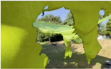
Das Sonnensegel wurde durch den Brand vollständig zerstört.

In der Nacht von Mittwoch auf Donnerstag ist im Masvingo-Park in der Schafstraße in Rommelshausen ein Sonnensegel mutwillig in Brand gesetzt und erheblich beschädigt worden. Der Brand ereignete sich am Mittwoch, 1. Juli 2026, zwischen 22:45 Uhr und 23:15 Uhr. Der Sonnenschutz fällt bis auf Weiteres aus.