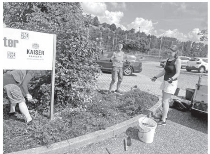
Unkraut jäten, Boden lockern und mehr

Das Ergebnis kann sich sehen lassen! Danke, allen zehn Helferinnen und Helfern!