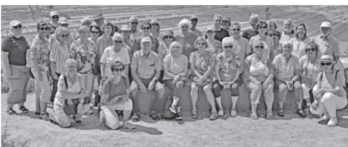
Im Hintergrund der noch aktive Tagebau Hambach

Eindrücke demnächst auf unserer Homepage