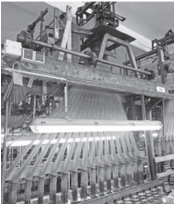
Der historische Webstuhl der Bandweberei Kafka ist noch voll in Betrieb

Vier abwechslungsreiche Tage voller interessanter Eindrücke und schöner gemeinsamer Erlebnisse verbrachten wir rund um den Deutschen LandFrauentag in Essen.