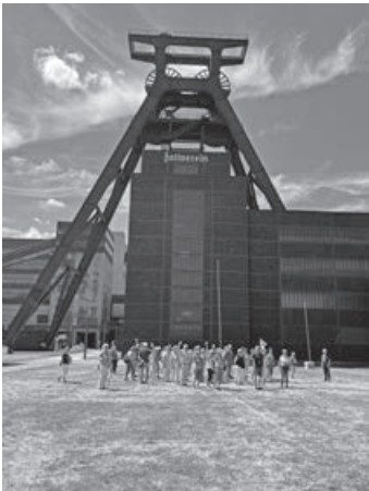
Zeche Zollverein, Welterbe der UNESCO

Nach einem gemeinsamen Frühstück im Nachtigallenhof begann unsere Reise mit einer Fahrt in der berühmten Wuppertaler Schwebebahn. Anschließend erhielten wir in der traditionsreichen Bandweberei Kafka spannende Einblicke in die Kunst des Bandwebens.