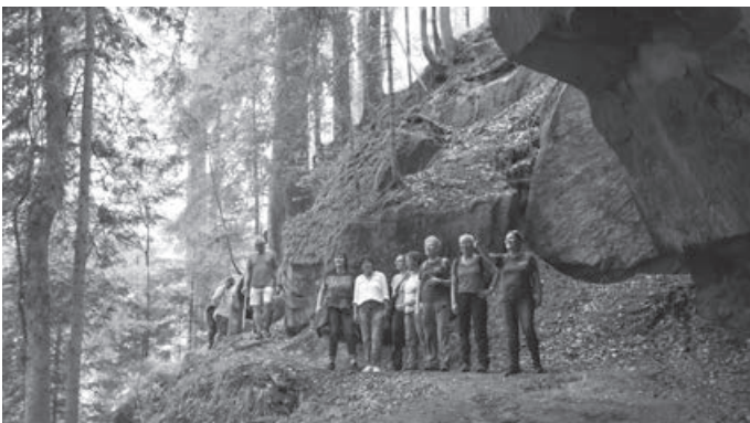
260630_BILD_Sommer mit den Naturparkführern_Sanwald/Naturpark: Gemeinsam mit den Naturparkführern Schwäbisch-Fränkischer Wald durch die schattigen Schluchten des Naturparks wandern

Wenn die Sommersonne heiß vom Himmel scheint, dann zieht es die Naturparkführer Schwäbisch-Fränkischer Wald und ihre Gäste in die schattig kühlen Wälder und Schluchten des Naturparks. Welche Pflanzen und Tiere nennen diesen Lebensraum ihr Zuhause? Und welche geschichtsträchtigen Ereignisse haben hier vor langer Zeit stattgefunden? Denn z.B. die wildromantischen Bachläufe dienen nicht nur zum Erfrischen der müden Wandererfüße, sondern wurden früher zum Flößen von Holz genutzt. Für alle Erholungssuchenden werden verschiedenste Waldbaden- und Meditationstouren angeboten. Und an inklusiven Veranstaltungen werden "Sommerspaß für ALLE am Schäferwagen" (12.07.2026) und "Ebnisee für alle" (02.08.2026) genannt. Außerdem gibt es in den Sommerferien spannende Ferienprogramme für Schülerinnen und Schüler. Diese und viele weitere Termine finden sich in der "Naturpark aktiv"-Brochure und auf www.die-naturparkfuehrer.de . Die Naturparkführer freuen sich darauf ihre Gäste begrüßen zu dürfen!