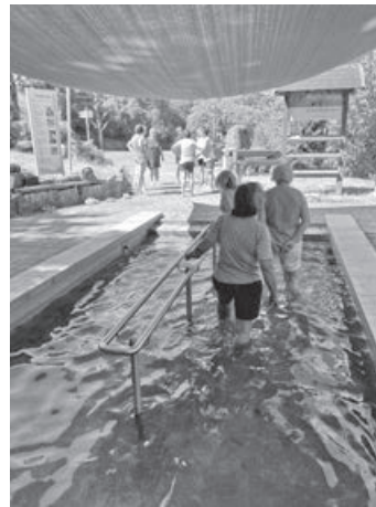
Kneippbecken Allmersbach i.T.

Am Samstag, 4. Juli, trafen wir uns am Kneippbecken in Allmersbach i.T. und erfuhren Wissenswertes über die Gesundheitslehre von Sebastian Kneipp. Im Mittelpunkt standen seine fünf Säulen: Wasser, Bewegung, Ernährung, Heilpflanzen und Lebensordnung. Anschließend wurde das Kneippbecken natürlich auch selbst ausprobiert. Ein informativer und erfrischender Vormittag, der zeigte, wie einfach sich Kneipps Ideen in den Alltag integrieren lassen.