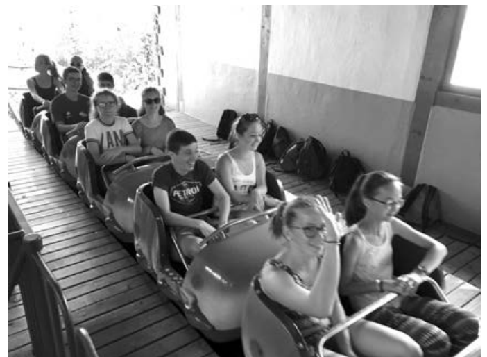
Finde neue Freunde beim Jugendaustausch (S. Thiel)

Dann wende Dich an T.Schmid@Fotografie-Schmid.com