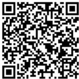
Die Kinder hochkonzentriert bei der Sache und der scannbare QR-Code. –Rico Mistl