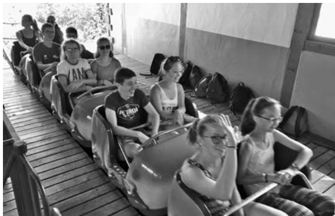
In Tripsdrill (S. Thiel)

Dann wende Dich an T.Schmid@Fotografie-Schmid.com