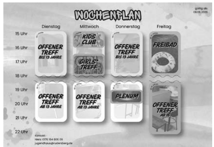
Der Wochenplan für den Sommer im Jugendhaus

E-Mail: n.bauder@rudersberg.de, Tel. 01 76 / 16 48 06 09