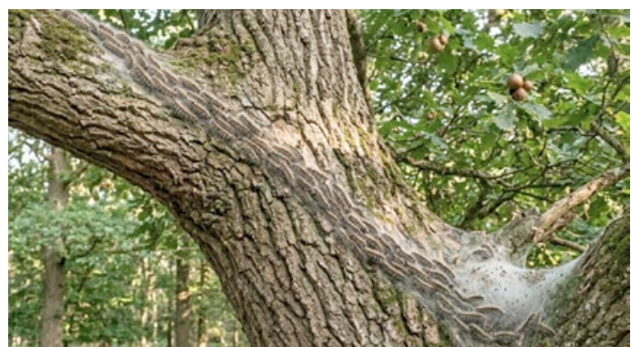
Eichenprozessionsspinner am Baum

Wie soll ich vorgehen, wenn ich ein Nest des Eichenprozessionsspinners entdecke?