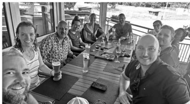
Spannende Matches mit anschließendem gemütlichen Beisammensein...so macht Tennis Spass.:-)