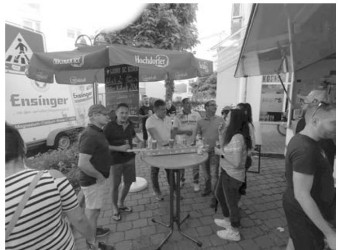
Archivbild vom Stand im letzten Jahr

Vom 19-21 Juni werden die Korber Löwen wieder ein reichhaltiges Angebot zu erschwinglichen Preisen anbieten.