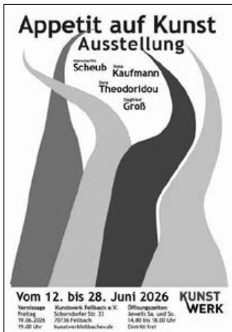
Ausstellungsplakat Appetit auf Kunst