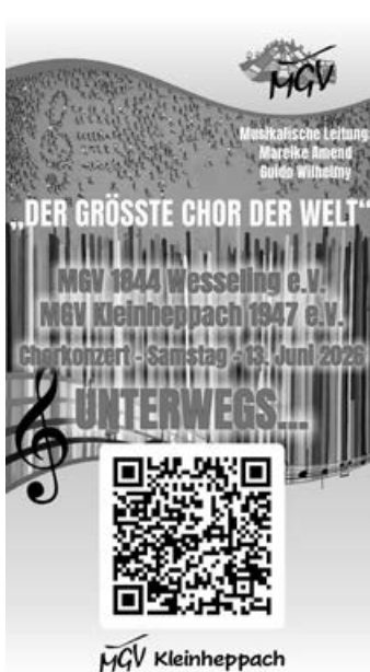
QR Code – Chorkonzert

Wie ihr dorthin kommt? Ganz einfach: Zückt euer Smartphone, scannt den QR-Code auf dem untenstehenden Plakat und entdeckt direkt alle Infos zum Konzert. Wir sehen uns am Samstag, dem 13. Juni in der Mehrzweckhalle!