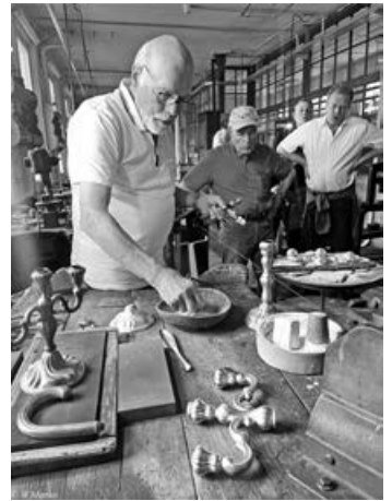
Besuch bei Ott-Pauser

Wir bedanken uns herzlich für die tolle und lebendige Führung. Den Teilnehmern hat der Besuch sehr gefallen. Ebenso danken wir allen, die dabei waren.