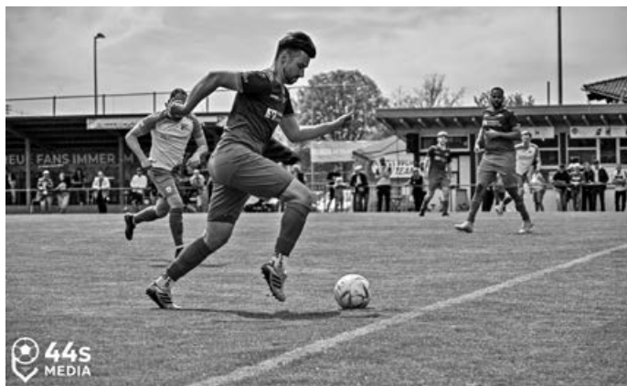
Die Zweite im Vorwärtsgang.