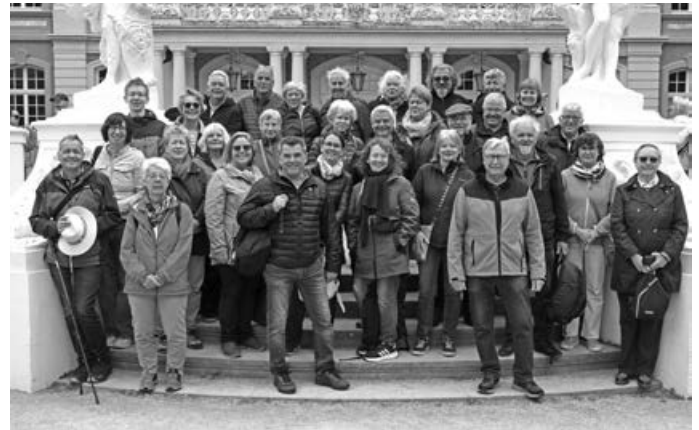
Die Ausflugsgruppe in Trier