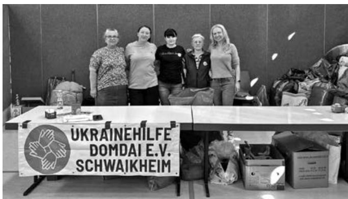
Stand bei Warentauschtag

Liebe Schwaikheimerinnen, liebe Schwaikheimer, am 9. Mai fand wieder ein Warentauschtag in der Gemeindehalle und wir durften erneut unseren Stand aufbauen. Es ist wirklich eine tolle Aktion und wir freuen uns, dass wir uns im Sinne der Wieder- und Weiterverwendung beteiligen können.