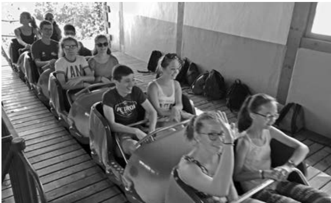
Finde neue Freunde beim Jugendaustausch (S. Thiel)

Diese Jahr kommt die französische Jugend nach Schwaikheim. Nächstes Jahr geht es für Euch nach Frankreich! Die Teilnahme kostet 120 Euro. Interesse? Fragen? Mitmachen? Noch gibt es freie Plätze! Dann wende Dich an T.Schmid@Fotografie-Schmid.com