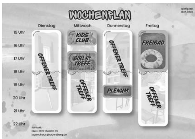
Der Wochenplan für den Sommer im Jugendhaus

Unterstützt und begleitet von Niels Bauder E-Mail: n.bauder@rudersberg.de, Tel. 01 76 / 16 48 06 09