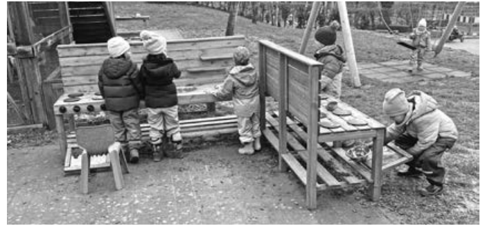
Der Küchenbetrieb ist eröffnet

zusätzlich von der Firma KLZ Vertrieb mit einer äußerst großzügigen Spende in Höhe von 5000 € bedacht wurde. Diese Unterstützung kam genau zur richtigen Zeit und machte es möglich, den Restbetrag für die Matschküche vollständig zu finanzieren.