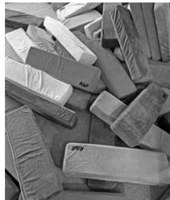
Bunte Bausteine laden zum Kreativsein ein

Darüber hinaus konnten wir uns dank der Spende einen weiteren lang gehegten Wunsch erfüllen.