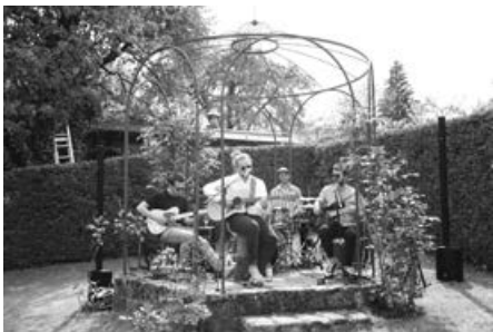
The Rolacas

...Fortsetzung von letzter Woche: Gärten, Kultur, Kunst, Musik