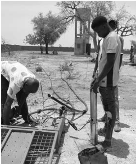
Die Wasserpumpe wird untersucht

Und nun ist ausgerechnet am Höhepunkt der Trockenzeit die Pumpe des Wasser- turms ausgefallen. Ein Experte musste am 9. Mai einen Totalschaden feststellen. Die Wasserstelle auf dem Yenfaabima-Gelän- de wird von vielen AnwohnerInnen und Flüchtlingen täglich genutzt. Zum Glück konnte der Freundeskreis Yenfaabima schnell reagieren und 770 € zur Beschaf- fung einer neuen Pumpe überweisen. Und auch in Burkina Faso wurde schnell gehandelt, so dass bereits am 16. Mai der Wasserturm wieder befüllt werden konn- te. Mit einem großen Dankeschön an alle SpenderInnen in Deutschland er- reichte uns ein Film, in dem wieder sau- beres Trinkwasser aus 81 m Tiefe in vol- lem Strahl aus dem Pumpenrohr sprudelt.