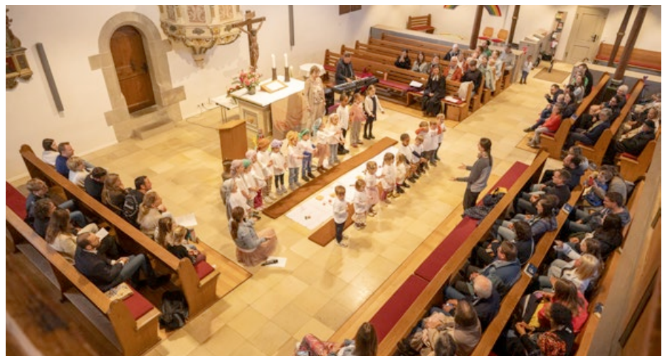
Volle Kirche beim Jubiläumsgottesdienst zum 100. Geburtstag.