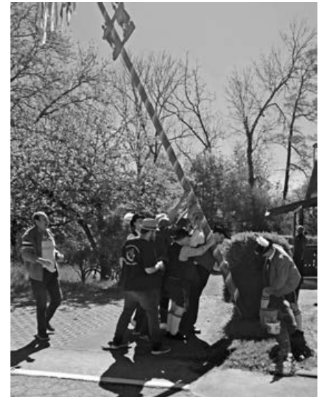
mit Muskelkraft den Maibaum gestellt