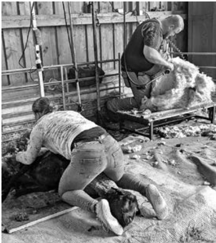
zweierlei Schurmethode

Die steigenden Temperaturen haben unseren Mutterschafen in den letzten Tagen ganz schön eingeheizt. Klar – Wolle ist temperaturlausgleichend – aber ein dicker Wollmantel bei sommerlichen 25 Grad ist dann doch zu viel. Wie gut, dass der ersehnte Friseurtermin dann pünktlich zum ersten Maiwochenende stattfinden konnte.