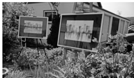
Garten und Kunst