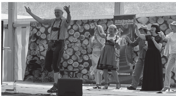
DJ Ötzi, Heidi und Doris Day bei der Hitparade – ein Best of der bekanntesten Songs.

Mit Musik, guter Stimmung und vielen schönen Erinnerungen wurde das Seniorenfrühstück der Gemeinde Berglen im Festzelt des Berglesbond auch in diesem Jahr zu einem besonderen Erlebnis für die Gäste.