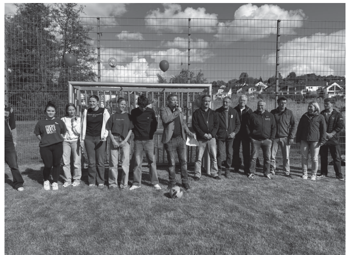
Der Jugendgemeinderat und der Gemeinderat feierten den erfolgreichen Abschluss des Projektes.

Die ersten Spielerinnen und Spieler kommen am Tag der Einweihung vom Gemeinderat und vom Jugendgemeinderat. Mannschaften aus beiden Gremien traten in einem Elfmeterschießen, das der Jugendgemeinderat in einem äußerst knappen Stechen für sich entscheiden konnte, gegeneinander an.