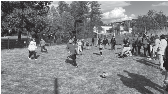
Direkt nach der Eröffnung tummelten sich gleich viele Spielerinnen und Spieler auf dem neuen Bolzplatz.