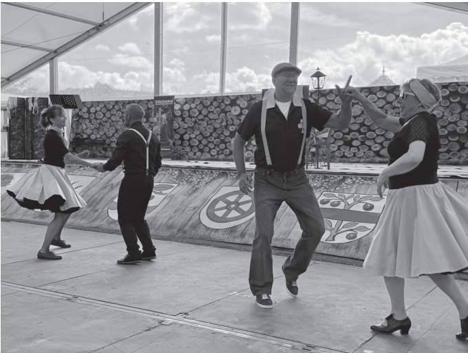
Die Boogie-Woogie Gruppe schwang das Tanzbein in prächtigen Petticoats.

Für große Begeisterung sorgten außerdem die schwungvollen Boogie-Woogie-Vorführungen.