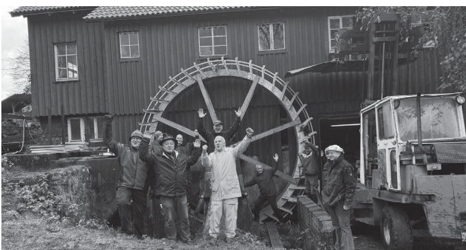
Mühlenteam Bau neues Mühlrad an der Hundsberger Sägmühle

So eine Wanderung kann ganz schön hungrig machen, deshalb gibt es an allen teilnehmenden Mühlen eine Bewirtung. Auf der Homepage des Schwäbischer Wald Tourismus e.V. finden sich ausführliche Informationen zum kulinarischen Angebot an diesem Tag.