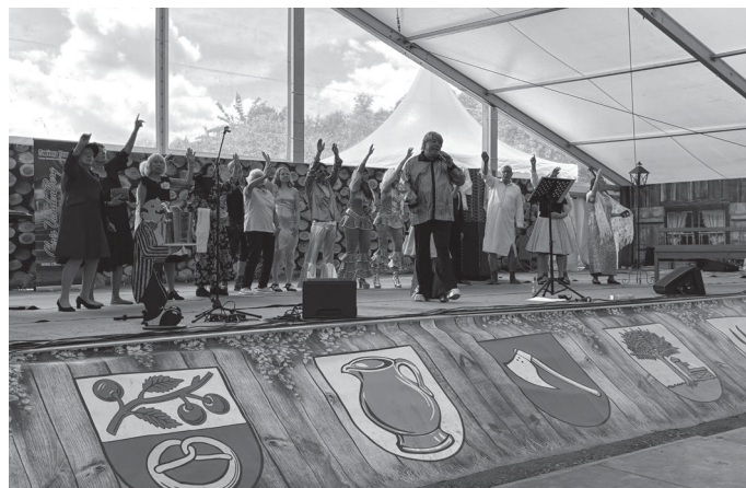
Der Veteranenclub Bretzenacker e. V. sorgte für gute Stimmung und schöne Erinnerungen im Festzelt.