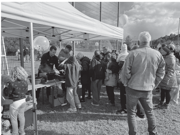
Zur Stärkung gab es rote Wurst und Pommes.