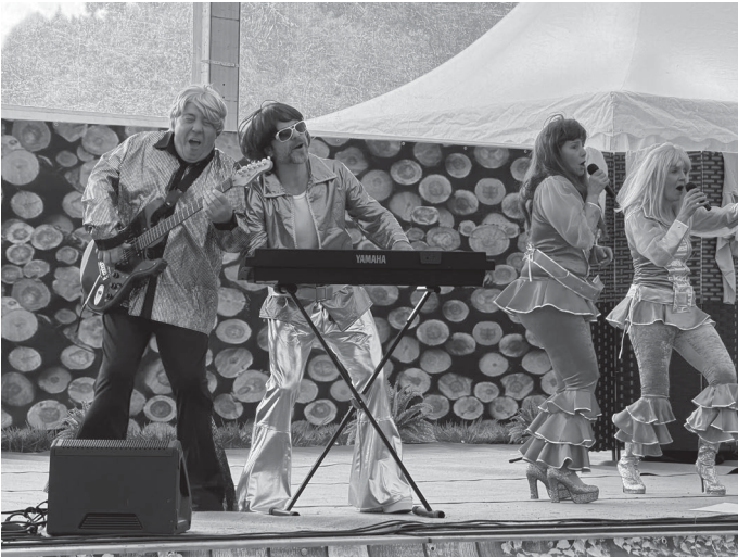
Große Begeisterung beim ABBA-Medley.

Für große Begeisterung sorgten außerdem die schwungvollen Boogie-Woogie-Vorführungen.