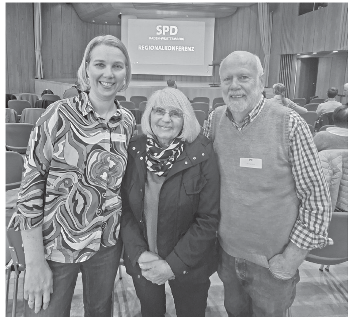
SPD-Regionalkonferenz in Waiblingen

Die Unterlagen für die Mitgliederbefragung sind versendet. Die Mitglieder haben nun bis zum 15. Juni 2026 Zeit, ihre Stimme abzugeben. Wir rufen alle SPD-Mitglieder auf, von diesem Wahlrecht Gebrauch zu machen!