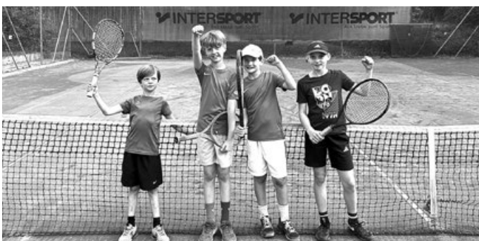
Wow – 29:1?! Das nennt man souverän!

Auch die Staffelspiele, bei denen Teamgeist, Schnelligkeit und Geschick gefragt sind, konnten komplett gewonnen werden. Da diese Wettbewerbe bislang nicht unbedingt zu den größten Stärken der Mannschaft gehörten, war die Freude darüber umso größer – ein rundum gelungener Start in die Sommersaison. Steffen Scheder