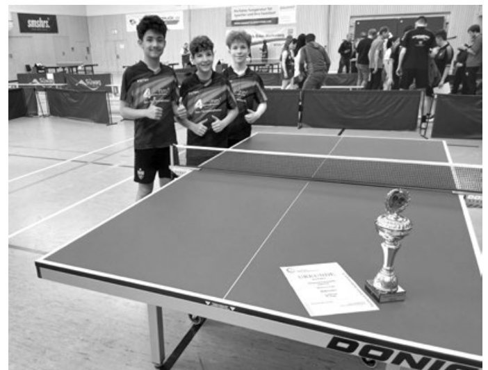
Bezirkspokalsieger Jungen14

Ganz anders dagegen das Finale, denn Birkmannsweilers Spitzenspieler war deutlich spielstärker. Betreuer Jozef Sabo konnte durch die frei wählbare Aufstellung eine geschicktere Konstellation der Einzel erreichen. Ante startete mit einem klaren Sieg die Begegnung. Am Nachbartisch kam es gleich zur Begegnung der stärksten Spieler. Hier war Spannung angesagt, denn erst im fünften Satz musste sich Finn-Luca knapp geschlagen geben. Auch Michali tat sich im folgenden schwer und verlor äußerst knapp mit 10:12 im Entscheidungssatz. Wichtig war jetzt der Gewinn des Doppels, um die Partie noch offen zu gestalten. Finn-Luca und Ante zeigten hier gute Übersicht und schafften den 2:2-Zwischenstand. Ante hielt danach gegen den Spitzenspieler zwar gut mit, verlor trotzdem in drei Sätzen. Doch Michali und Finn-Luca gewannen die beiden ausstehenden Spiele und feierten mit dem Pokal das Double.