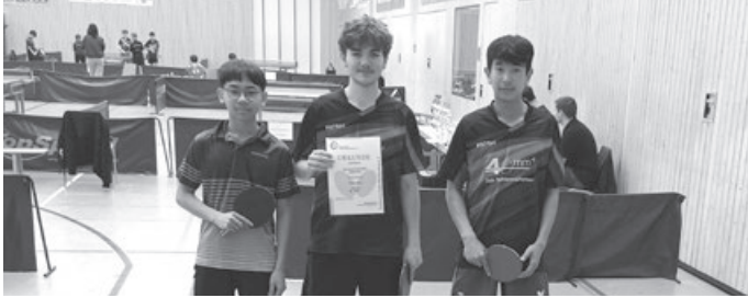
Vize-Bezirkspokalsieger Jungen 19

Gegen den hohen Favoriten ging es eher darum, gut mitzuhalten. Und das gelang ganz ordentlich. Mit 1:2 nach einem Erfolg für Mark ging es im Doppel spannend zu. Do/Mark stellten sich gut ein und erst im Entscheidungssatz ging das Doppel an Plüderhausen. Im Spitzenspiel konnte Do zwar gut mithalten, unterlag aber in drei Sätzen. Damit wurde Beinstein Zweiter, unter dem Strich ein gutes Abschneiden.