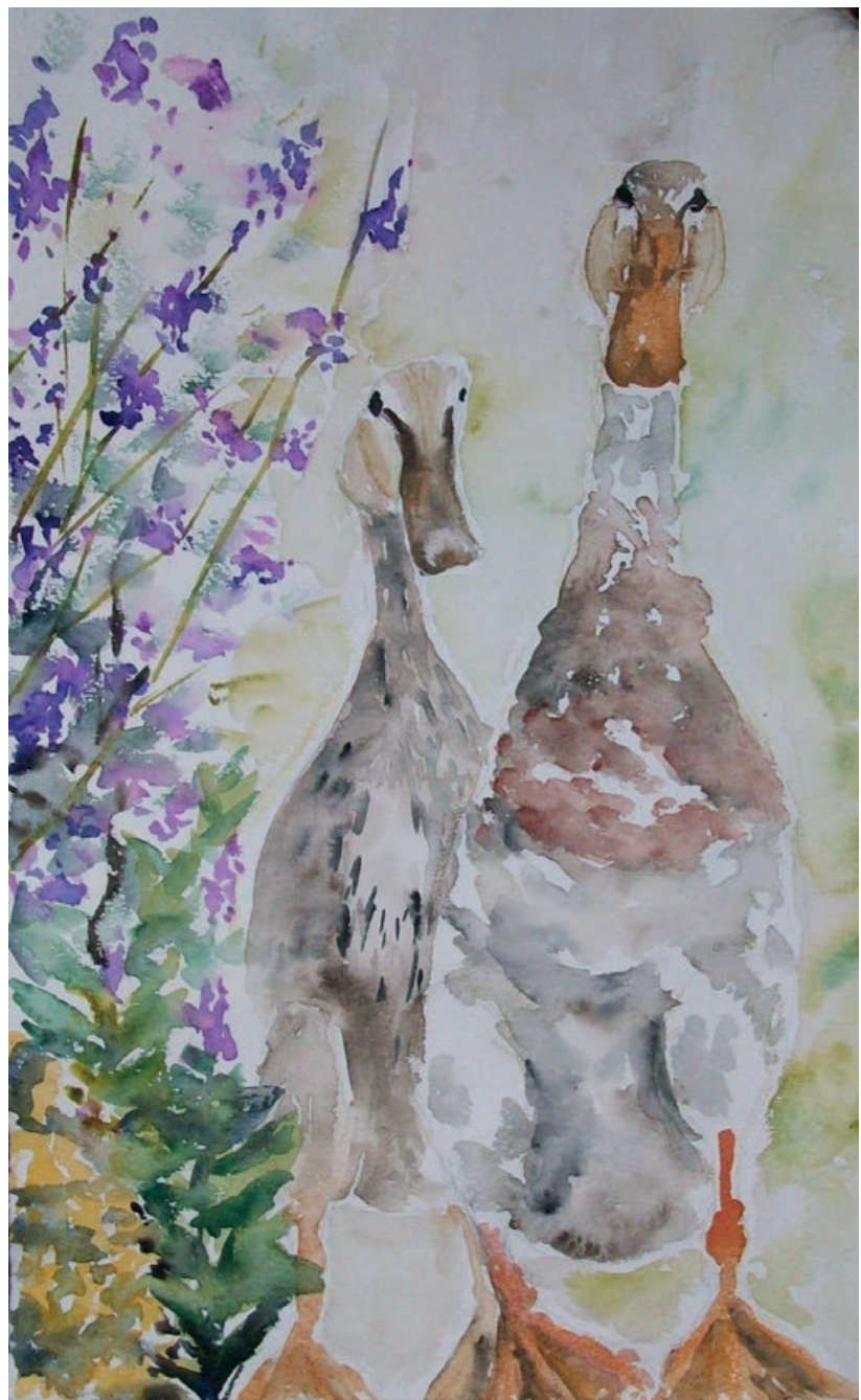
Ute Munz, Beinstein (Aquarell)