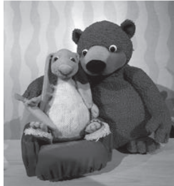
Wolfsburger Figurentheater Compagnie