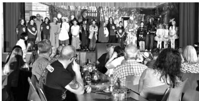
Die Akteure nach der Aufführung – glücklich über das Geleistete und mit viel Applaus verabschiedet.