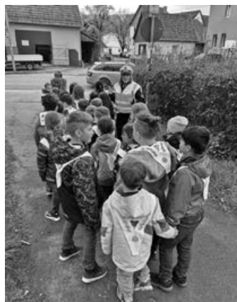
Praktische Übungen am Zebrastreifen