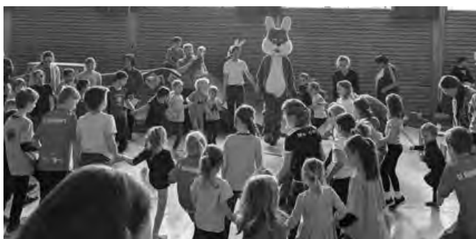
Besonderes Highlight: die Kinderdisco und der Besuch vom Osterhasen.

Danke dem Kinderhaus Pustebume gab es zudem ein großes Kuchenbuffet, das von den Gästen gerne angenommen wurde.