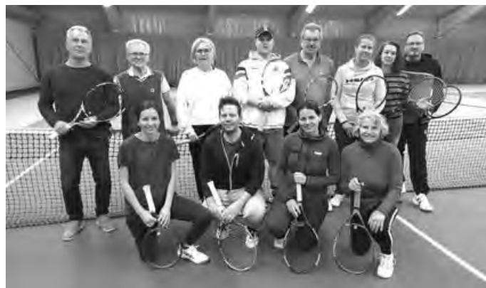
12 wackere Damen und Herren trafen sich zum Hallenabschlussturnier...