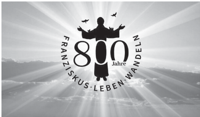
Leben im Wandel