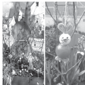
Osterdekoration am Lindenplatz

Bei 6 Grad und strahlendem Sonnenschein haben wir zusammen mit dem Kindergarten Hebsack am vergangenen Freitag den Lindenplatz geschmückt. Die Blumenkübel an Lindenplatz und Kelter wurden frühlinghaft bepflanzt und ganz traditionell sang der Kindergarten für das Publikum ein passendes Lied. Im Anschluss hingen die Kinder ihre selbst gebastelten Hasen in die Zweige. Zur Stärkung gab es Marmorkuchen, Quarktiere, Osterkekse und selbstgepressten Apfelsaft. Herzlichen Dank an den Kindergarten, der jedes Jahr aufs Neue mit uns den Frühling einläutet!! Die Hasen freuen sich auf einen Besuch am Lindenplatz und wünschen ein frohes Osterfest!