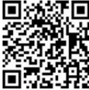
QR-Code zum Schichtplan

Save the Date: Am 30. April bewirbt die Fußballabteilung des SC Korb erstmals gemeinsam mit dem BDS Korb den Tanz in den Mai am Seeplatz. Für Musik und Stimmung sorgt der Partygraf von Liebenstein . Mitglieder bitten wir um die Ableistung ihrer Arbeitsstunden – beim Fest besteht dazu die Möglichkeit. Über zahlreiche Helferinnen und Helfer freuen wir uns sehr, damit die Veranstaltung ein großer Erfolg wird. Den Schichtplan zum Eintragen finden Sie per QR-Code sowie unter https://lukify.app/xvgfpi . Auch Nichtmitglieder sind schon heute herzlich eingeladen; nähere Infos zu Essen, Getränken und Ablauf folgen rechtzeitig vor dem Fest.