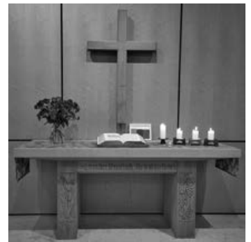
Karfreitag und Ostern in der Versöhnungskirche.

10:00 Uhr Gottesdienst; gleichzeitig Kinderkirche.