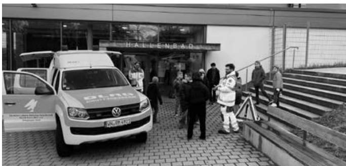
Einsatzfahrzeug der DLRG Korb vor dem Hallenbad

Vor einigen Tagen haben Helfer unserer Einsatzgruppe unser Einsatzfahrzeug den Kindern des aktuellen Juniorretter-Kurses präsentiert. Dabei wurde den Kindern das Equipment und das Einsatzfahrzeug vorgestellt. Die Kinder waren sehr daran interessiert, was die Strömungsretter der DLRG Ortsgruppe Korb alles an Ausstattung bei sich tragen, um anderen in Not zu helfen. Das Interesse war teilweise so groß, dass die Kinder am liebsten gleich selber die Ausbildung zum Helfer machen wollten. Das freut uns sehr, dass unser Nachwuchs scheinbar schon gesichert ist.