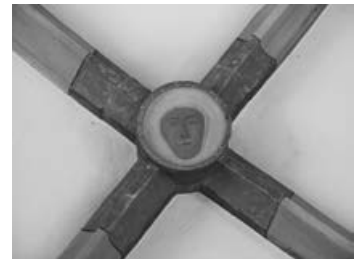
Turmerdgeschoss: Schlussstein im Deckengewölbe

Wir laden Sie herzlich ein zur Kirchenführung in die evangelische Kirche in Korb, Kirchstr. 10, am Samstag, 11. April 2026, um 17:00 Uhr. Im Dialog mit alten Mauern und Steinen lassen wir uns durch die Geschichte des ältesten und interessantesten Bauwerks unseres Ortes führen. Wir beginnen bei den Steinen, die uns in die Anfänge dieser Kirche führen, in die Zeit der Gotik. Diese finden wir im Turmerdgeschoss. – Ostern: Wir grüßen alle Mitglieder, Unterstützer, Freunde und Leser und wünschen ein erholsames, frohes und gesegnetes Fest.