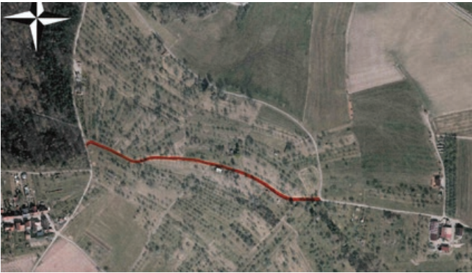
Gewann Storrenäcker, Gemarkung Vorderweißbuch, Flur Streich: Teilfläche von Flst. 536