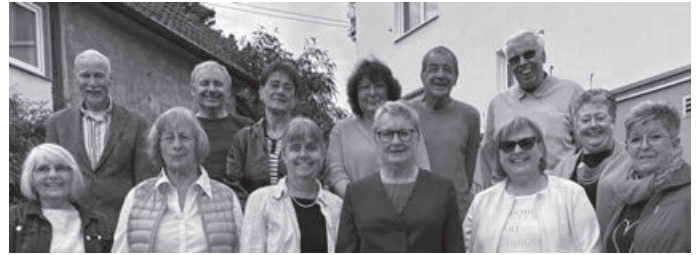
Ihr Seniorenrat Berglen

Danke dafür. Die daraus resultierende Tagesordnung geben wir fristgerecht bekannt.