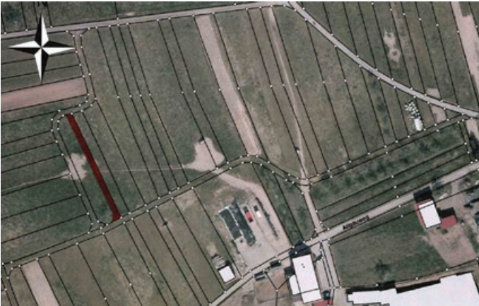
Gewann Brunnenwiesen, Gemarkung Bretzenacker: Teilflächen von den Flurstücken 137/1, 137, 192, 136, 100, 135, 221, 220, 224/3, 224, 1028, 1029/1