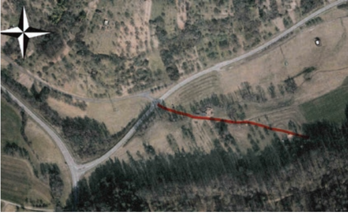
Gewann Fichtenbüsche, Gemarkung Oppelsbohm: Flst. 877 und Teilflächen von den Flurstücken 692, 691, 689/1, 689/2, 879, 637