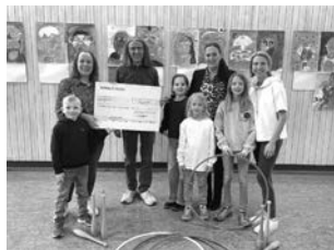
Scheckübergabe in der Aula der Grundschule Schnait