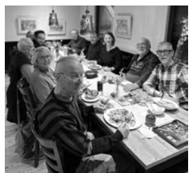
offener Treff in Schnait

...war auch diesmal gut besucht mit Gästen, Mitgliedern und Teilen unserer Ratsfraktion. Meinungen-Ansichten-Diskussionen: Das schmerzhafteste Ergebnis der Landtagswahl, bezogen auf unseren Wahlkreis und insbesondere Weinstadt stand im Mittelpunkt der Gespräche aber auch die Weinstädter Themen u.a. das drängende Thema des bezahlbaren Wohnraumes (siehe auch Haushaltsrede Teil 2) und fehlende Sanierung der Schul toiletten in den Bestandsschulen, die Herausforderung der Gemeinderatsarbeit genauso wie die aktuelle Entwicklung auch der SPD Weinstadt.