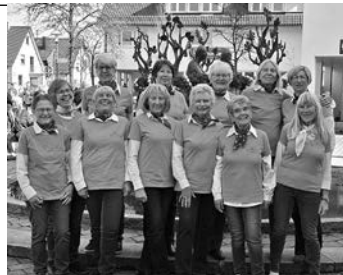
Foto: Linedancegruppe LandFrauen Aichwald