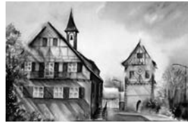
Die Bücherei Aichwald und die Schanbacher Kirche – von Jürgen Maier gemalt ist nur noch bis 28.03.26 zu sehen

Seit Anfang Januar verschönern Aquarelle von Jürgen Maier die Wände der Bücherei Aichwald. Sollten Sie die Ausstellung noch nicht bewundert haben, können Sie das nur noch bis 28. März tun. Am 31. März wird abgebaut und für eine neue Ausstellung Platz gemacht: die großformatigen Acryl-Bilder von Rüdiger Bliesener sind dann ab 1. April 2026 zu sehen.