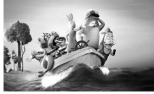
„Fuchs und Hase retten die Welt“ C: Neue Visionen

NL/BE/LUX 2024, 72 Min, FSK: o.A., Regie: M. Halberstad, Animationsfilm, empf. ab 5 J. Der Biber Justin ist mächtig stolz auf seinen gigantischen Staudamm mit integriertem Vergnügungspark. Er ist sich sicher: Für dieses Meisterwerk werden die restlichen Waldtiere ihn lieben! Doch als dadurch der Wald geflutet wird, merkt er erst, was Freundschaft bedeutet und dass man mit ihr vielleicht sogar den Wald retten kann.