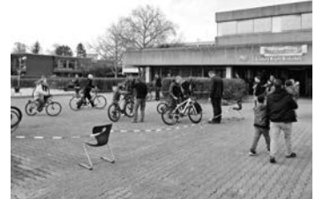
Probefahren auf dem Schulhof