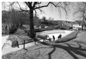
Das Team Liegenschaft hat bereits mit der Grundpflege begonnen

In der vergangenen Woche wurde das Freibad offiziell von der Stadt Weinstadt an den Freibadverein Strümpfelbach e.V. übergeben. Mit diesem Termin ist ein wichtiger Meilenstein auf dem Weg zur eigenständigen Bewirtschaftung erreicht. Der Verein erhielt weitere Schlüssel, womit ein weiterer organisatorischer Punkt abgeschlossen werden konnte. Parallel zur Übergabe laufen die praktischen Vorbereitungen auf Hochtouren: Das Team Liegenschaft hat bereits mit der Grundpflege des Geländes begonnen. Zudem haben engagierte Mitglieder das leere Schwimmbecken abgeschliffen – ein zentraler Schritt für die anstehenden Neuanstrich: Aktuell wird weiter gespachtelt, geschliffen und alles für den finalen Anstrich vorbereitet. Nun hoffen wir auf passende Wetterbedingungen, um mit dem Streichen beginnen zu können. Wir freuen uns Endspurt vor der baldigen Badesaison und bedanken uns sehr für die große Unterstützung der Mitglieder!