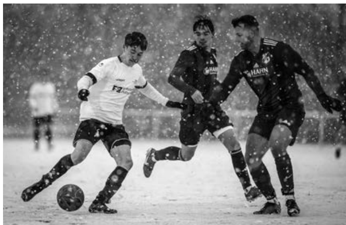
Fussball und Schnee vertragen sich nur bedingt.

Der Schnee bremst die Bemühungen um die Form und Leistungskurve nun aus.