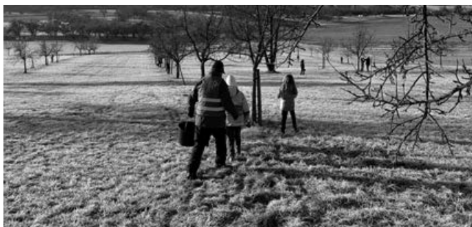
Die 4a und 4b bei -3 Grad im Dornhau

gel gelernt. Das Allerbeste aber war: Wir haben den Vögeln im Winter geholfen. Das war ein spannender und lehrreicher Tag!