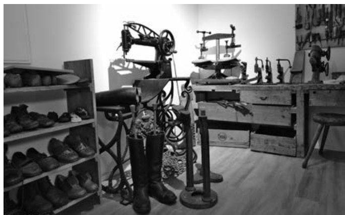
Schuhmacherwerkstatt Eugen Schüle

Das Heimatmuseum in der Goethestraße 20 ist am Sonntag, 1. Februar von 14:00 – 17:00 Uhr geöffnet. Im ehemaligen Milchhäusle werden zahlreiche Werkzeuge alter Handwerksberufe gezeigt. Mobiliar und Gebrauchsgegenstände, wie sie früher im bäuerlichen Alltag benutzt wurden, sind im Erdgeschoss und im 1. Obergeschoss zu sehen. Sie sind bei uns herzlich willkommen. Ein Besuch lohnt sich auf alle Fälle. Es gibt einiges zu entdecken.