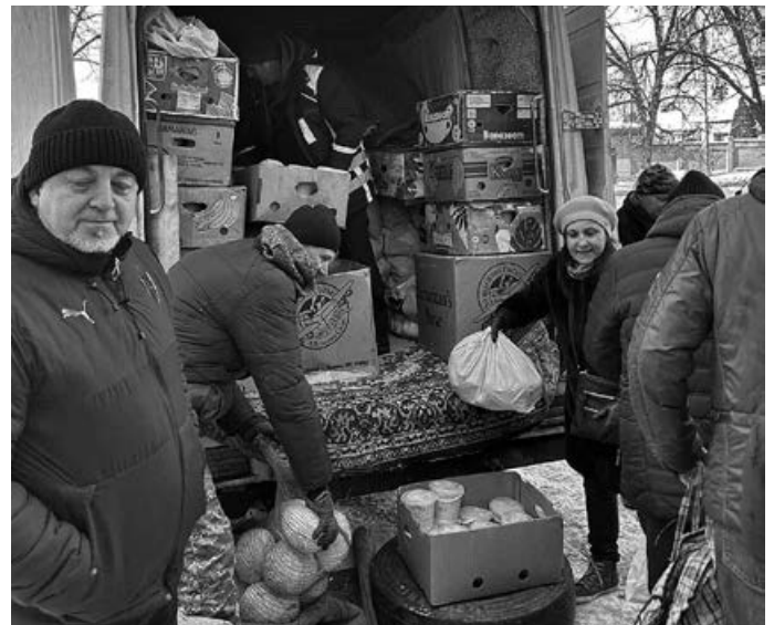
Hilfsgüterverteilung aus Schwaikheim in Charkiw

Liebe Schwaikheimerinnen, liebe Schwaikheimer, liebe Freunde und Unterstützer, die Meinungen über die Hilfen für die Ukraine allgemein sind sehr unterschiedlich. Wir haben nur eine Meinung: wir möchten, dass der Krieg beendet wird, und wir wollen den notleidenden Menschen dort auch langfristig helfen.