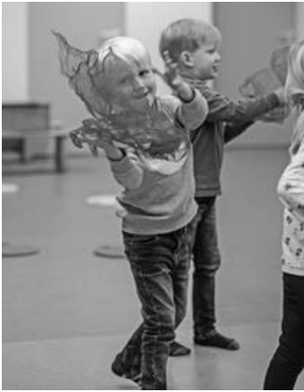
Für die Jüngsten an der Musikschule starten im April neue Kurse.

Einige Kurse der „Rhythmisch-musikalischen Früherziehung“ sind bereits ausgebucht, es lohnt sich der Blick auf die Homepage der Musikschule. Auf www.jms-schorndorf.de findet man neben weiteren Informationen auch Kurszeiten und Hinweise auf belegte Kurse.