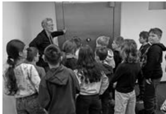
Klasse 3 bei der KSK Schorndorf Vor der großen Türe des Tresors