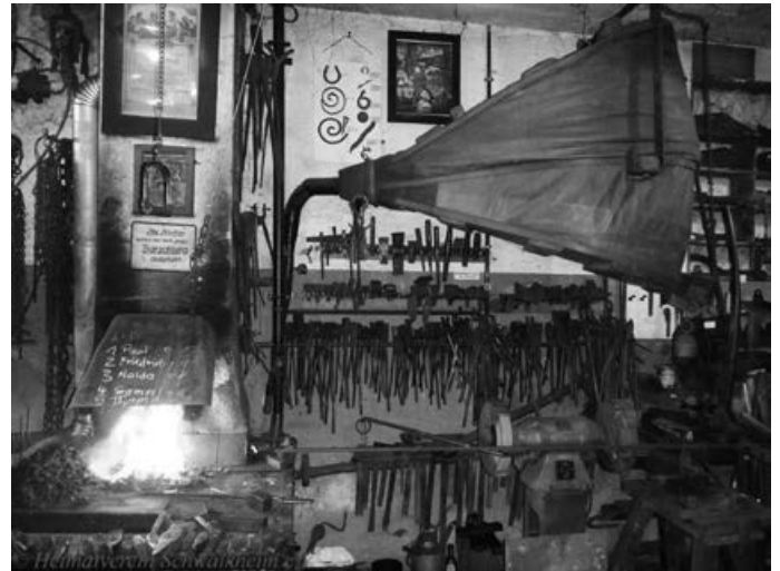
Bestes Schmiedefeuer durch Blasebalg

Eine Bitte hätten wir noch: bringen Sie doch für das Heißgetränk Ihren eigenen Becher mit. Weitere Einzelheiten zur Veranstaltung entnehmen Sie bitte den folgenden Mitteilungsblättern.