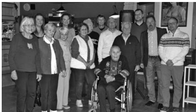
Geehrte Mitglieder für 25, 40, 50, 60 und 70 Jahre Zugehörigkeit zum TSV

Ihr wollt später auch mal zum Ehrungstag eingeladen werden? Oder Euch sportlich betätigen?