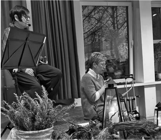
Jahresabschluss 2025- Dieses Jahr mit einer Märchenerzählerin