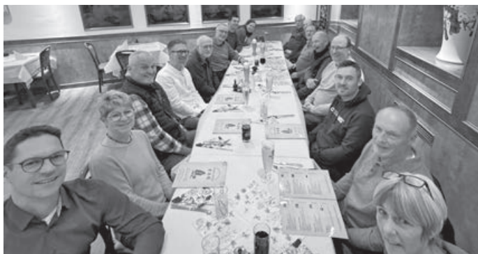
Das BES-Team beim gemeinsamen Abendessen zum Jahresabschluss

Als Dank für das Engagement und zum Abschluss eines erfolgreichen Jahres waren alle Ehrenamtlichen des Aktiven BES-Teams zu einem Abendessen eingeladen und ca. 2/3 waren dann auch dabei. Wir freuen uns über das große Team für vielfältige Aufgaben, um gemeinsam unsere Projekte und Aktionen bewältigen zu können. Das ist auch die Basis für unsere guten Jahresergebnisse, die mit Personalkosten so nicht erzielbar wären. Wir freuen uns auf zukünftige Aktionen, wie beispielsweise die Stecker-PV Aktion 2026, weitere PV-Anlagen und Großprojekte, auch wenn die Vorarbeiten hier teilweise recht zäh sind.