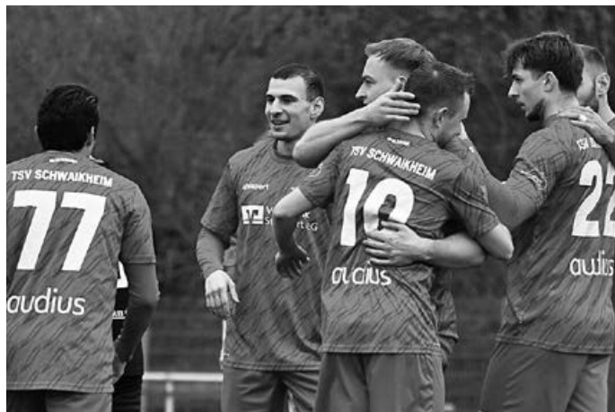
Wer gut spielt, hat was zu feiern

Mit dem dritten Sieg in Folge verabschiedete sich die Erste in die Winterpause. Beim Tabellenletzten konnte man früh die Weichen auf Sieg stellen. Bereits nach 18 Minuten lag man 3:0 vorne. Zuerst traf Pascal Conti mit einem abgefälschten Schuss, dann drückt Dennis Becher eine Hereingabe von Daniel Klemm über die Linie. Der dritte Treffer ging auf das Konto von Christos Stergiou, der den Ball aus 16 Metern ins Eck setzte.