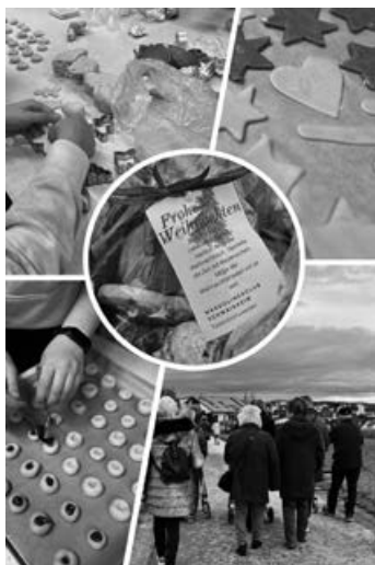
Weihnachtsg Gebäck (MCS)

Und so konnten wir am Montagmittag die Seniorinnen und Senioren des "Spaziergangs gemeinsam statt einsam" begleiten und ihnen anschließend den kleinen weihnachtlichen Gruß unserer TastenEnthusiasten überreichen. Beim Spaziergang stellte sich heraus, dass einige in der Vergangenheit selbst bereits Akkordeon gespielt hatten oder unsere Vereinsfeste besucht hatten. Das zeigt: Musik verbindet über Generationen hinweg! Wir jedenfalls hatten große Freude beim Backen und auch beim Spaziergang rund um Schwaikheim.