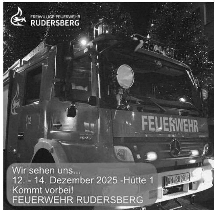
Adventswald Hütte 1 – Abteilung Rudersberg

Die Abteilung Rudersberg betreibt die Hütte 1 vom Freitag, 12.12.2025 bis Sonntag, 14.12.2025. Wir freuen uns auf zahlreiche Besucher und laden ein zu einer leckeren Wurstausswahl vom Grill, zu heißem Glühwein, Punsch oder einem Bier. Die Standeinteilungen sind bekannt, dito die Zeiten.