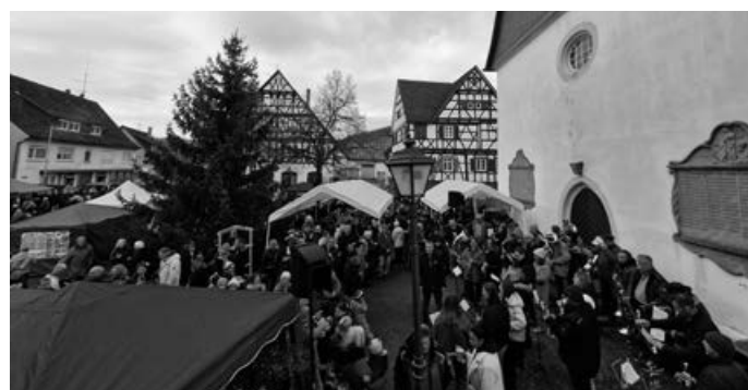
Steinenberger Weihnachtsmarkt.