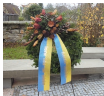
Kranzniederlegung auf dem Friedhof in Buoch