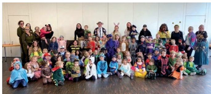
Die Kinder vom Kinderhaus stürmen das Rathaus

Am 27.2. fand der traditionelle Rathaussturm statt. Rund 80 Kinder aus dem Kinderhaus stürmten in bunten Kostümen als Feen, Super-