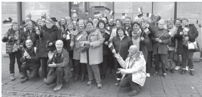
Besuch des Gournayer Chors

allen Besucherinnen und Besuchern bedanken, die unseren Stand auf dem diesjährigen Weihnachtsmarkt besucht haben. Es war ein Tag voller Begegnungen, festlicher Stimmung und intensiven Austauschs. Dank Ihrer Unterstützung war unser Stand ein voller Erfolg und wir konnten unsere Partnerschaften und die damit verbundenen Werte von Freundschaft und Zusammenhalt in den Mittelpunkt stellen.