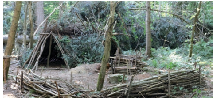
Bei den Rundgängen im Wald konnten die Spielstätten der Kinder besichtigt werden.

Am 18.7. feierten die BuochFinken ihr einjähriges Bestehen mit einem Sommerfest mitten im Wald. Bei Leckereien und geführten Rundgängen lernten die Gäste besondere Orte wie das „Waldwohnzimmer“ kennen – liebevoll gestaltete Plätze, die den Alltag der Kinder prägen. Das erste Jahr war geprägt von Gemeinschaft: Eltern, Erzieherinnen und Kinder haben gemeinsam viel aufgebaut – vom Bauwagen bis zur Feuerstelle. Aktuell besuchen 14 Kinder den Waldkindergarten, im kommenden Jahr werden es voraussichtlich 17 sein. In naturnaher Umgebung erleben sie hier die Jahreszeiten hautnah und wachsen in einer starken Gemeinschaft.