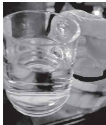
Ein Punsch oder Glühwein am Feuer