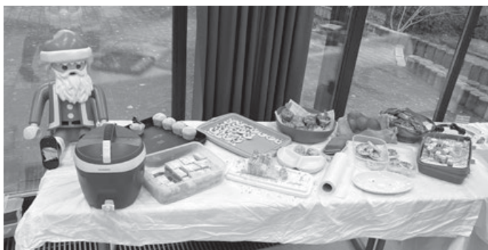
Das leckere Buffet der Eltern!

Dieses Jahr gab es an unserer Adventsfeier ein Krippenspiel mal auf eine ganz besondere Art und Weise. Es kamen viele außergewöhnliche Tiere an die Krippe: u. a. Löwen, Tiger, Giraffen oder auch die Vogelsträube wollten sehen, was an der Krippe geschehen war.