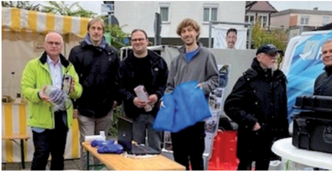
Infostand des Hochwassermobils

Am 7.10. machte das Infomobil des Hochwasser Kompetenz Centruns e.V. (HKC) auf dem Wochenmarkt in Grunbach Station. Bürgerinnen und Bürger konnten sich dort kostenfrei umfassend über Schutzmöglichkeiten vor Starkregen und Hochwasser informieren. Anhand von Modellen und anschaulichem Material wurden verschiedene Präventionsmaßnahmen für Gebäude und Grundstücke vorgestellt. Fachkundige Expertinnen und Experten beantworteten Fragen, gaben praktische Empfehlungen zu baulichen Schutzmaßnahmen und informierten über das richtige Verhalten im Ernstfall.