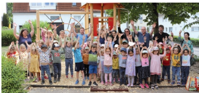
Die Kinder freuen sich über das neue Spielgerät

Nachdem Ende letzten Jahres der Spielplatz Rohrbronn renoviert werden konnte, wurde am 26.6. der neue Spielturm mit Kletternetz