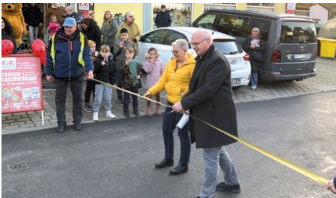
Kleine Eröffnung der Wilhelm-Enßle-Straße

Die Wilhelm-Enßle-Straße wurde von November 2024 bis November 2025 komplett saniert und von Grund auf neu aufgebaut. Gas- und Wasserleitungen wurden von der Rathausstraße bis zum Ahornweg, ca. 330 m, erneuert. Damit verbunden der Ausbau bestehender Leitungen und Erneuerung einzelner Hausanschlussleitungen. Es wurden ca. 2.500 m 2 Asphaltarbeiten durchgeführt, sowie Stromanschlüsse einiger Gebäude von Dachständer-Hausanschlüsse auf Erdkabelanschlüsse umgerüstet. Die städtebauliche Erneuerungsmaßnahme „Ortsmitte Geradstetten II“ wurde mit Mitteln des Landes Baden-Württemberg im Landessanierungsprogramm gefördert. Im Rahmen dieser Maßnahme wurden bereits der Weinbergweg, die Gaisgasse, die Glockengasse sowie der Ochsegarten und ein Teilbereich der Rathausstraße saniert.