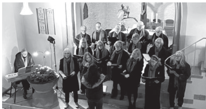
Buocher Chor singt Gospels