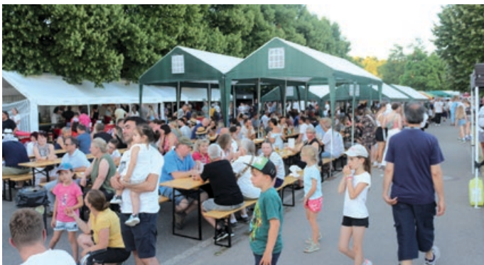
Viele Bürgerinnen und Bürger besuchten das Straßenfest

Auf dem Wochenend-Programm standen Darbietungen verschiedener Tanz- und Musikgruppen sowie musikalische Unterhaltung verschiedener Bands. Die teilnehmenden Vereine versorgten alle Besucherinnen und Besucher bestens mit ihrem kulinarischen Angebot. Am Sonntag rundete der Flohmarkt, der HGV-Markt und das bunte Kinderprogramm das Wochenende ab.