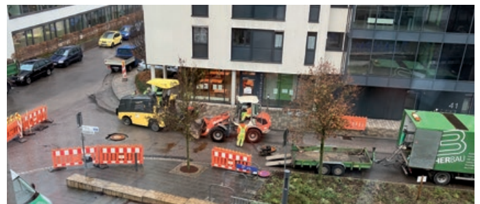
Die Bauarbeiten in vollem Gange

Am 24.11. starteten die Asphaltarbeiten der Firma Fischer Straßenbau in der Fronäckerstraße. Durch die fachgerechte Sanierung wird die Lebensdauer der Straße verlängert und zukünftiger Instandhaltungsaufwand reduziert.