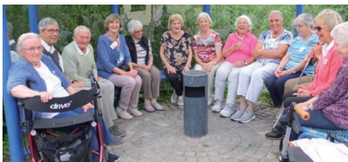
Senioren und Seniorinnen bei der Seniorenfreizeit

Unter dem Thema „Männer und Frauen die unser Leben bereichern“ fand vom 1. bis 5. September die interkommunale Seniorenfreizeit Urlaub ohne Kofferpacken statt. 33 Personen (22 aus Remshalden, 11 aus Winterbach) genossen die Tage im Christlichen Begegnungszentrum Aichenbach am Schorndorfer Waldrand.