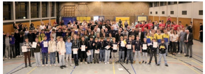
Zahlreiche Sportlerinnen und Sportler werden in der Wilhelm-Enßle-Halle geehrt

Am Freitag, 14.11. wurden 183 jugendliche und erwachsene Sportlerinnen und Sportler für ihre Erfolge in der vergangenen Saison ausgezeichnet. Die Ehrungen erfolgten in den Sportarten Handball, Fußball, Volleyball, Tennis, Tischtennis, Turnen/Hip Hop, Rope-Skiping, Marathon, Schwimmen und Schach. Insgesamt wurden 142 Ehrungen in Bronze, 43 in Silber und 2 in Gold verliehen. Die Ehrungen erfolgen gestaffelt nach Sportarten. Nach den Ehrungen wurde das Publikum von den „Einradwiesel“ der Einradabteilung des TV Miedelsbach mit einem Auftritt unterhalten. Wie in jedem Jahr durfte auch die traditionelle Tombola nicht fehlen und für das leibliche Wohl der Gäste war ebenfalls bestens gesorgt.