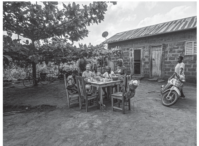
In Benin essen die Männer zuerst