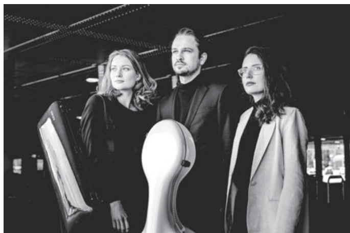
Avin Klaviertrio

Samstag, 22. November 2025, 19:00 Uhr, Glockenkelter Kernen-Stetten Eintritt: 21,00 Euro, ermäßigt 13,00 Euro (Schüler und Studierende) Kartenreservierung unter klassikkonzerte.stetten@yahoo.com oder telefonisch Tel. 01 51 / 23 41 88 81