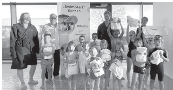
Gelungene Überraschung für die Kinder

noch Freikarten für einen Hallenbadbesuch, die uns dankenswerterweise von der Gemeinde zur Verfügung gestellt werden.