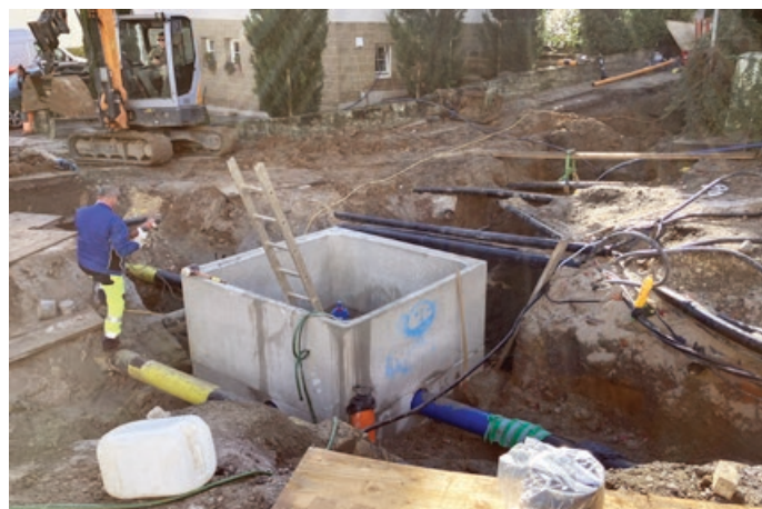
Das Foto zeigt die Situation im Kreuzungsbereich Pommerstraße / Kleinfeldstraße mit den zahlreichen querenden Leitungen.

Wenn alles nach Plan läuft, soll der Kreuzungsbereich laut dem ausführenden Bauunternehmen im Laufe der Woche ab dem 17. November wieder befahrbar sein.