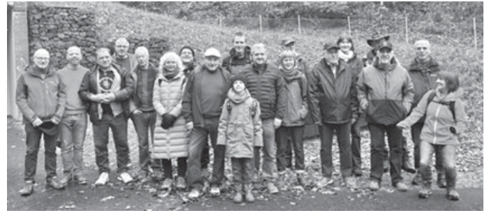
Das Wasserforum

Weitere Informationen zum Wasserforum Kernen gibt es unter: https://nachhaltiges-kernen.de/gruppen/wasserforum-kernen/