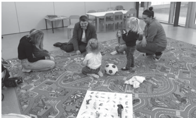
Kobolde und Betreuerinnen freuten sich über den Besuch des Bürgermeisters