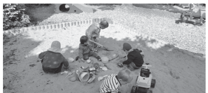
Kindertagespflegestelle "Zwergenland" in Rommelshausen

Die Kindertagespflege hat sich in den letzten Jahren zu einer immer professionelleren Tätigkeit in der Kinderbetreuung entwickelt. Die Tageseltern (Tagesmütter oder -väter) auch genannt Kindertagespflegepersonen qualifizieren sich mit 300 UE im Bereich der Pädagogik und Selbständigkeit mit eigenem Businessplan und Konzeption. Kindertagespflegepersonen sind in ihrer Arbeit autonom und können mit ihrem eigenen pädagogischen Schwerpunkt den Bildungs- und Erziehungsauftrag in der Kinderbetreuung umsetzen. Kindertagespflege kann in den eigenen Räumen, in den Räumen der Familie (Kinderfrau) oder in anderen geeigneten Räumen (Tagespflege in anderen geeigneten Räumen) stattfinden. Der Tageselternverein Fellbach & Kernen bekommt zunehmend Anfragen für die Betreuung von Kindern unter 3 Jahren, möchte die Betreuung in der Kindertagespflege weiter ausbauen und freut sich über interessierte Personen, die in diesem Bereich arbeiten möchten. Die nächsten Qualifizierungskurse starten am 24. Februar und 8. Mai.2024.