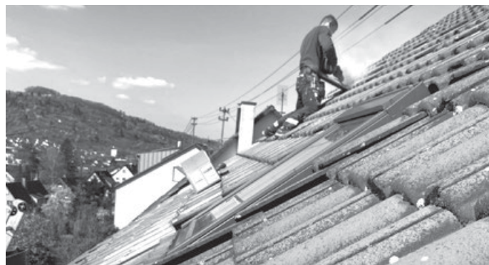
Die eigene PV-Anlage macht unabhängig von steigenden Strompreisen.

Für das kommende Jahr rechnet das Wirtschaftsministerium mit einem weiteren Preisanstieg bei den Strompreisen. Haben auch Sie schon darüber nachgedacht, eine Photovoltaikanlage auf Ihrem Dach zu installieren? Möchten Sie eine Expertenmeinung, ob Ihr Dach geeignet ist, welche Kosten auf Sie zukommen könnten, wie schnell sich die Investition amortisiert, welche Fördermöglichkeiten es gibt?