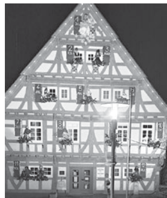
Altes Rathaus in Stetten