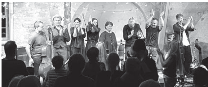
The Mamatoo

Vielen vielen Dank – auch und vor allem von der Band – an die vielen Helferinnen und Helfer in der Vorbereitung, beim Auf- und Abbau, beim Vorverkauf und an der Kasse, beim Essens- und Getränkeverkauf, beim Brötchen schmieren, spülen und überhaupt beim Dabeisein. Ohne Euch würde es solche und viele weitere kulturelle Ereignisse in Kernen nicht geben!