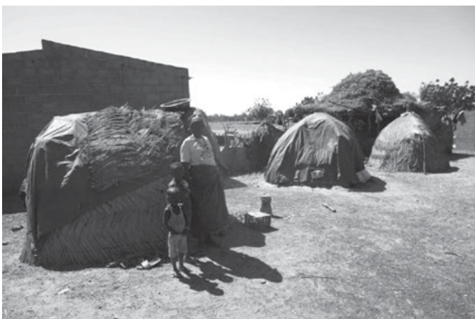
Provisorische Unterkünfte entlang der Straße

Zwischen dem 25. Mai und 17. August 2023 hielten sich in Piéla 24 595 Binnenvertriebene auf. Sie kommen aus einem Umkreis von 35 km. Damit hat sich die Einwohnerzahl praktisch verdreifacht.