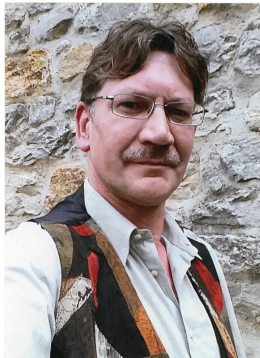
"der Mann mit dem weißen Hund"

Allen Verwandten, Freunden und Bekannten die uns auf liebevolle Weise beim Verlust unseres Sohnes