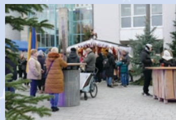
Winterflair im Außenbereich