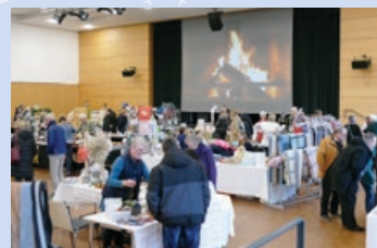
Standtreiben in Saal 1