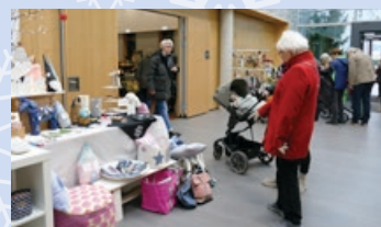
Stöbern und Staunen an zahlreichen Ständen